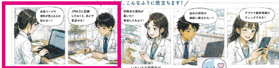
大学での勉強風景 2カット