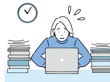
動画編集がもっとうまくなりたい人