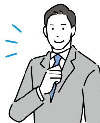
動画編集が得意な人