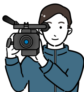
映像ディレクター