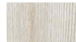
ホワイトアッシュ柾目