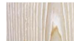
ホワイトアッシュ板目