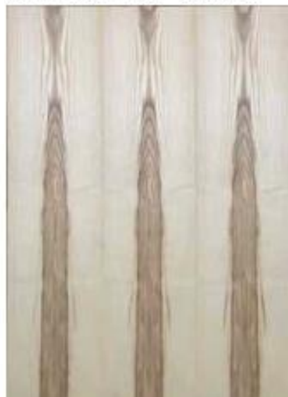
ホワイトアッシュ儀心 ブックマッチ