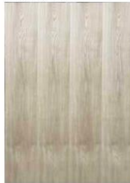
ナラ板目 スリップマッチ