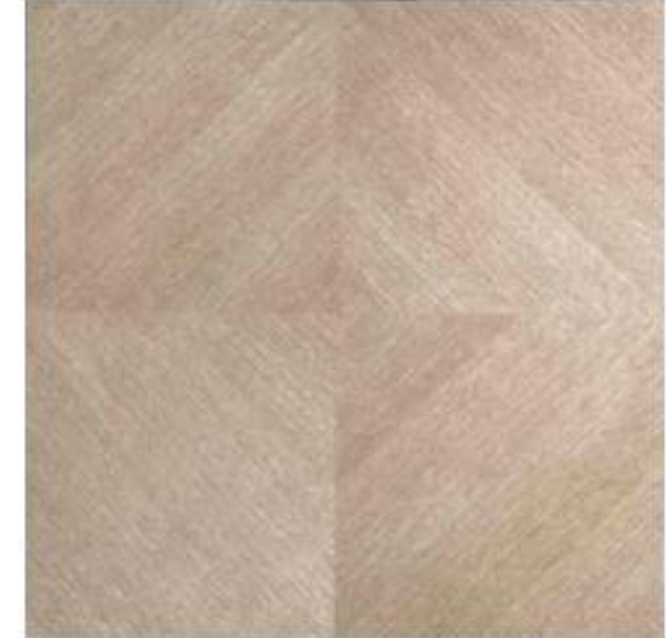
ナラ板目 ダイヤモンド貼り