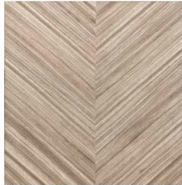
ゼブラ柾目 矢羽根貼り