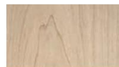
ハードメイプル板目