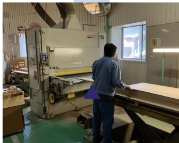
サンダー研磨(仕上げ)