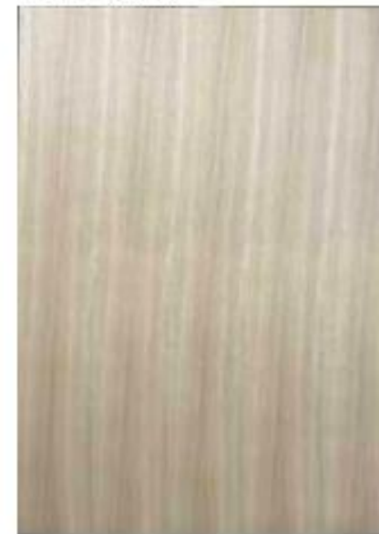
ナラ板目 交互貼り