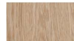
ホワイトオーク柾目