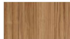
ゼブラウッド柾目