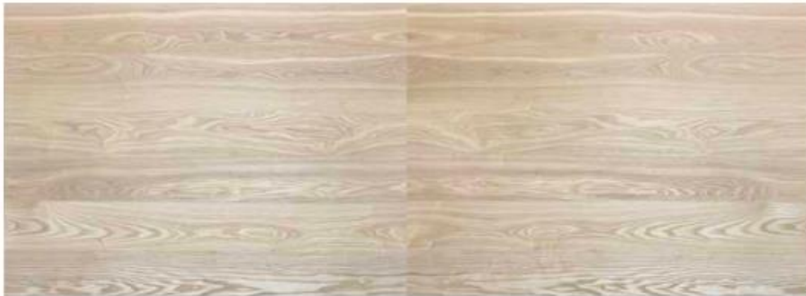
タモ板目 ブックマッチ