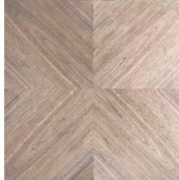
ナット板目 放射貼り