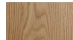
ホワイトオーク板目