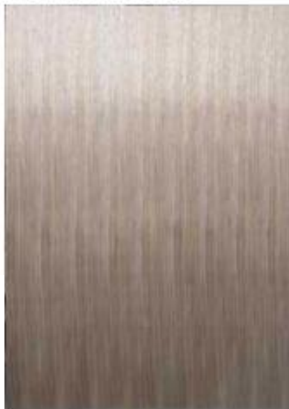
ナット柎目 スリップマッチ