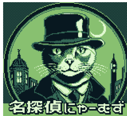
タイトル用 (リアル)