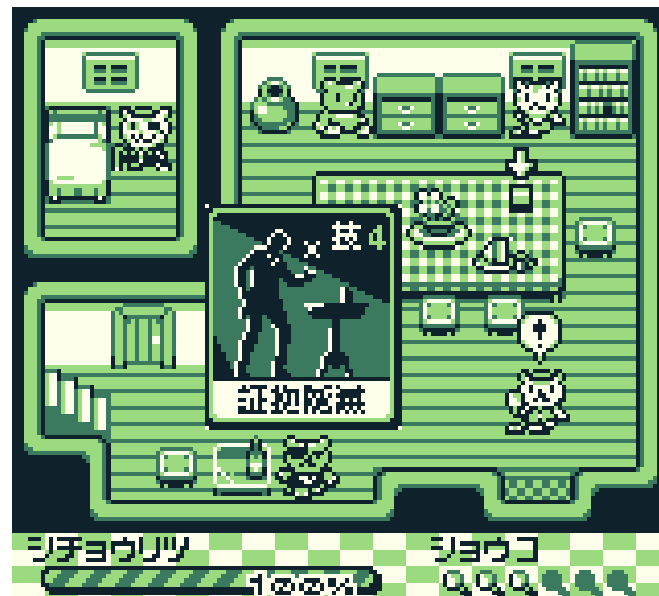
画面イメージ (実際には介入パートには探偵はいません)