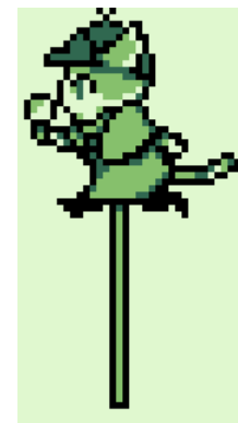
幕間・次回予告用