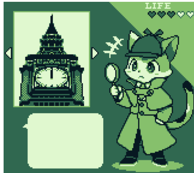
会話パートでのイメージ