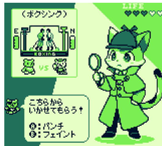
ミニゲーム(ボクシング)