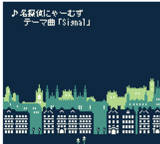
ステージオープニング(エンディング?)デモ

基本的にはアドベンチャーですが、途中でミニゲーム(設定でON/OFF可能)を入れる予定です。ミニゲームONの場合はクリアで解決、ミニゲームOFFの場合はパラメータによる自動判定の予定です。