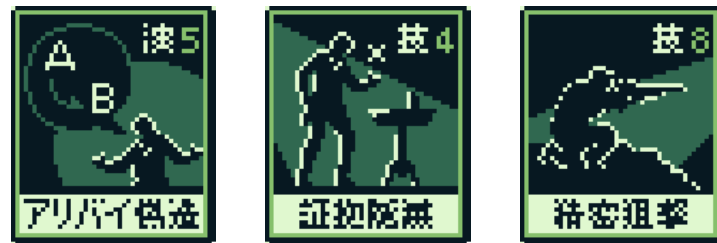
偽装用アイテムのイメージ