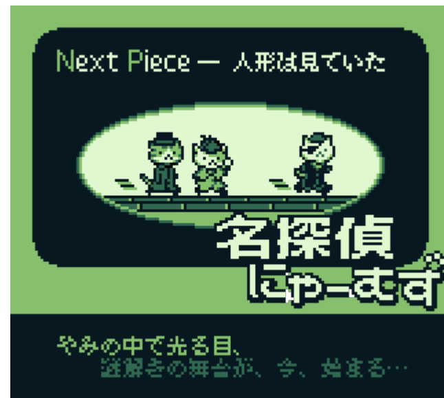
次回予告でのデフォルメキャラ（右）