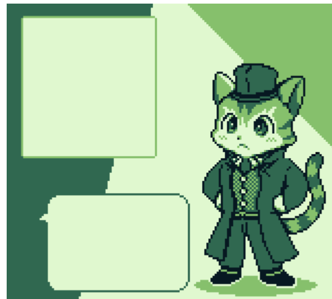
会話パートでのイメージ (修正予定)