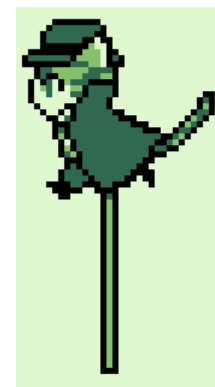
幕間・次回予告用