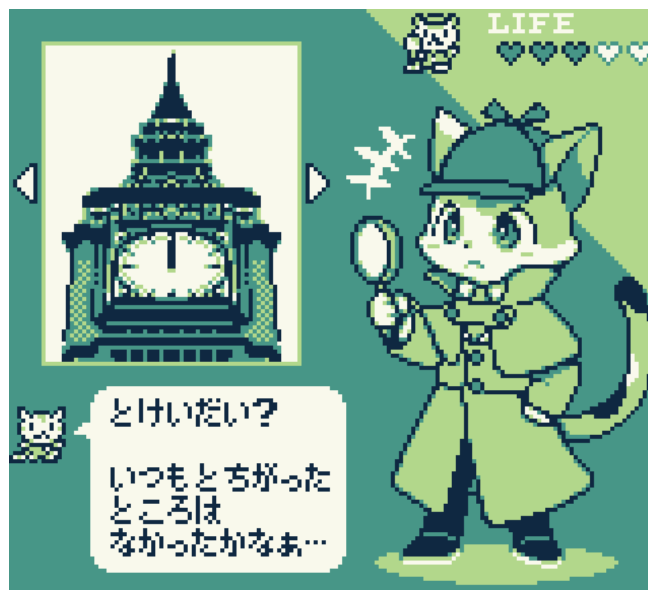
画面イメージ (上：通常シーン、下：尋問シーン)

ただし、謎はとてもシンプル。証拠品を調べて、必要な話を聞けば簡単にクリアできるイメージです。