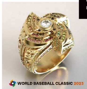
WORLD BASEBALL CLASSIC 2023