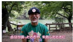
①自分が困ったときや失敗した時

自分の胸辺りを指さしながら(片手でも両手でもOK)、「自分を笑っていいよね。完璧じゃなかったっていいよね！」と思いながら笑います。