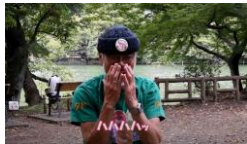
③口に手を当てて黙すかしがった