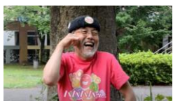
③大声で笑えない時はサイレントで