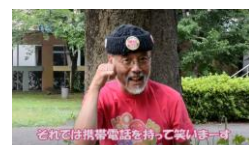
②相手の話を聞きながら笑います