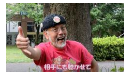
④自分以外の人にも聞かせて笑いま

詳しいエクササイズはYouTubeの動画でチェック 基本エクササイズ/携帯電話ラフター https://www.youtube.com/watch?v=Dz8UFc0KsSQ&t=2s