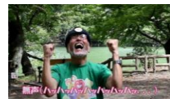
④好きなポーズ笑ってもOK！

詳しいエクササイズはYouTubeの動画でチェック 基本エクササイズ/サイレントラフター https://www.youtube.com/watch?v=gVKV6Fxm5SQ&t=1s