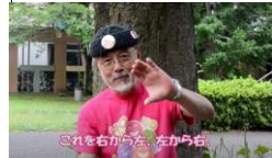
③これを右から左、左から右、