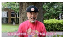
①想像の携帯電話を用意して

想像の携帯電話が鳴ったら電話に出て、相手の話を聞いているふりをしながら笑います。歩き回って人にも聞かせてあげたり、人の電話も聞いたりしながら更に笑いましょう