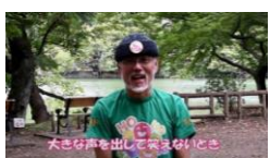
①大きな声を出して笑えないとき

場所を選ばずいつでも、どこでも出来るエクササイズです。声を出さずに笑います。声を出さなくて笑うと、以外とお腹に力が入りますよ！