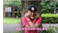
④腕を交差させたりもします！

詳しいエクササイズはYouTubeの動画でチェック 基本エクササイズ/許しラフター https://www.youtube.com/watch?v=bTClotEzMU4&t=1s