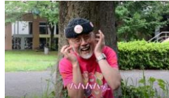
③インドでは耳たぶを持ち笑いま