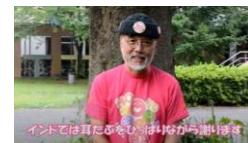
②自分を許し、人を許しましょう