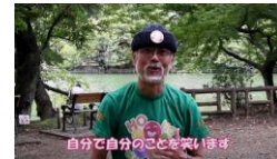
②自分で自分のことを笑います