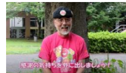
②感謝の気持ちを外に出しましょう