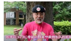
②左手のコップに季節の野菜や果物を入れます