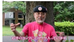
①右手のコップにミルクが入っています

両手にミルクの入ったコップを持ち、「えーっ」と言いながら片方に注ぎ、もう少し大きな声で「えーっ」と言いながら逆の方に注ぎ、そして飲みながら笑います。