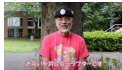
①お互いに許し合うラフターです

腕を広げ、手を開いて、相手を許すジェスチャーをします。自分を許し、人を許しましょう。インドでは自分の耳たぶを持ちながら許します。