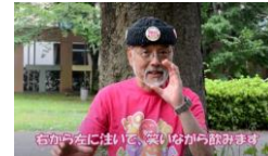
④右から左に注ぎ笑いながら飲みます

詳しいエクササイズはYouTubeの動画でチェック 基本エクササイズ/ミルクシェーキラフター https://www.youtube.com/watch?v=cluisOnluk&t=33s