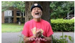
③手を合わせて感謝を表したり