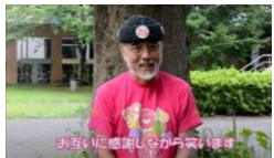
①お互いに感謝しながら笑います

人指し指と親指でOKサインを作ったり、親指を立てたり、拍手や投げキッス・ハイタッチなどをしながら感謝を表現します。