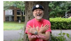
④胸に手を当ててもいいでしょう

詳しいエクササイズはYouTubeの動画でチェック 基本エクササイズ/感謝ラフター https://www.youtube.com/watch?v=ONOK8IONf6M