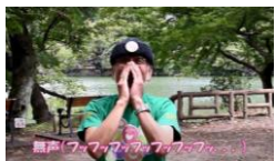
③口に手を当てて声を出さず笑った