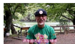
②声を出さずに笑います