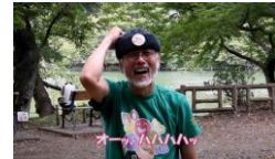
④頭をボンボンしても面白い

詳しいエクササイズはYouTubeの動画でチェック 基本エクササイズ/自分を笑うラフター https://www.youtube.com/watch?v=q4CUm623cWl&t=1s