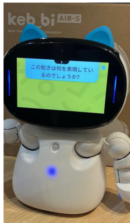
動作問題時のケビー