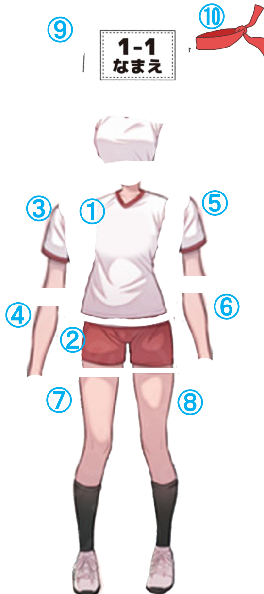
レイヤー分けイメージ