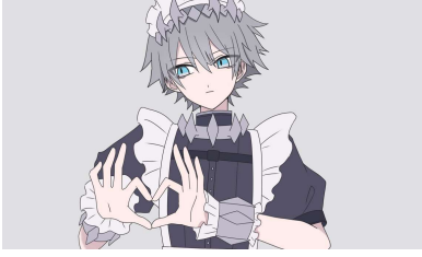
キャラクターイメージ①