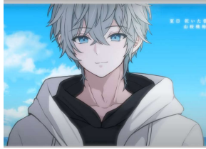
キャラクターイメージ③