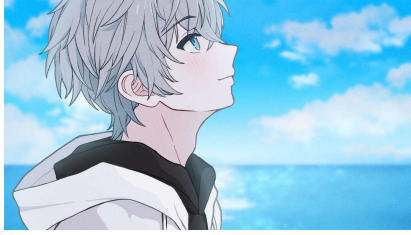
キャラクターイメージ②