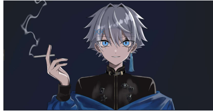
キャラクターイメージ④