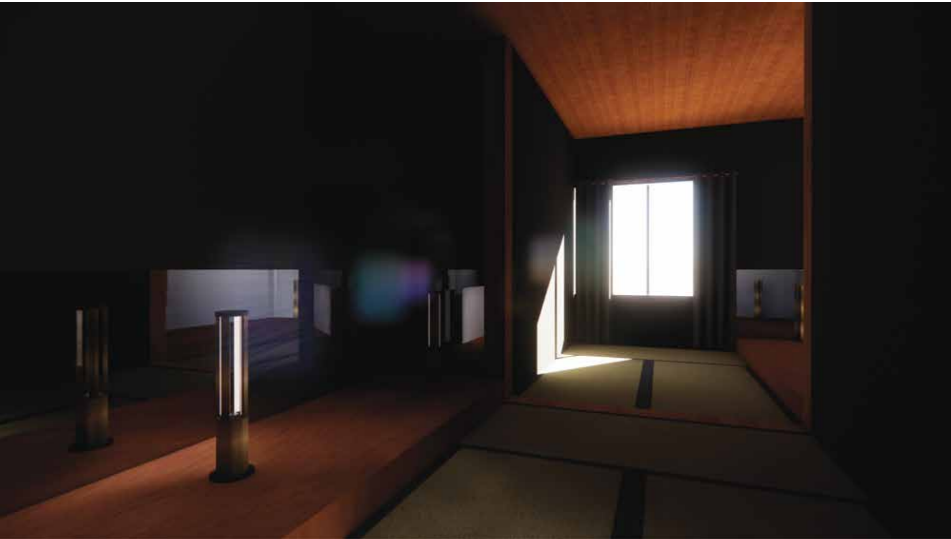
Second floor studio & bed room