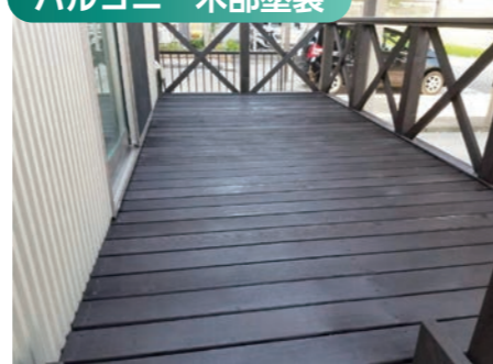
劣化を修復し、木部用塗装を塗布。