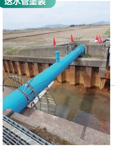
1 種ケレン、エポキシ樹脂錆止 2 回塗 ウレタン樹脂 2 回塗仕上