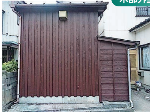
造膜タイプの木部塗装で長期間美観を保持。