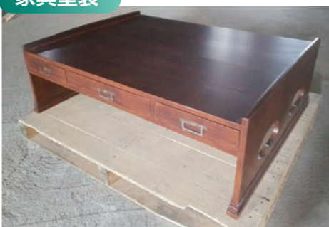
江戸時代、寺子屋に利用されていた机を修復し塗装。 ポリウレタン塗装仕上 (5分艶)