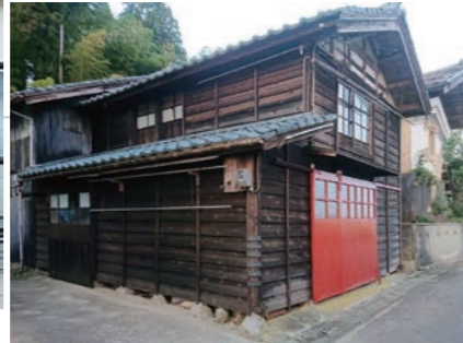
オイルステントタイプの塗装。自然な風合いに仕上げ。