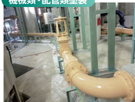
施設関連の設備等、状況に適した塗装を施します。