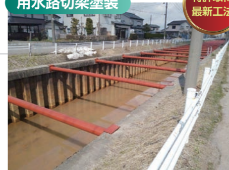
FRP 樹脂下塗 200μ ver ウレタン樹脂 2 回塗仕上