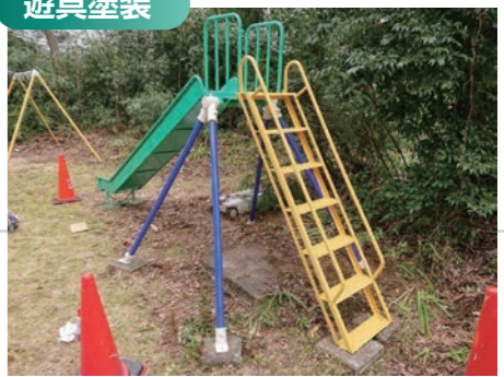
安全性を十分に確認しながら必要な塗装を施します。