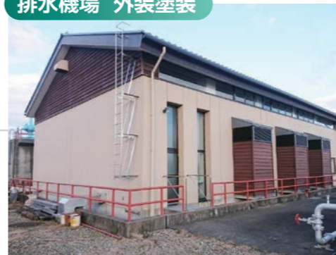
FRP 樹脂下塗 200μ ver ウレタン樹脂仕上 (3分艶)