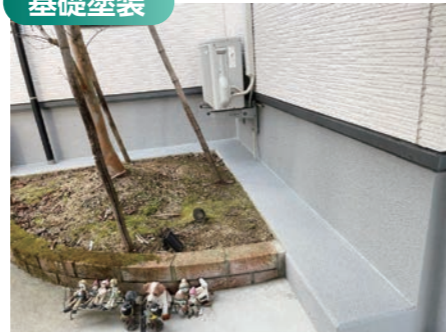
ひび割れしにくい弾性美装保護剤