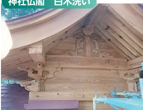
あく洗い、漂白、保護材等で白木を修復。