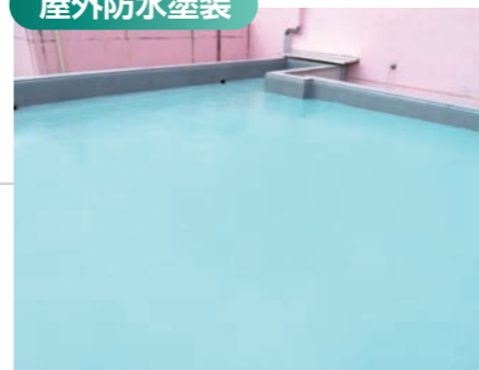
様々な塗膜防水に対応します。