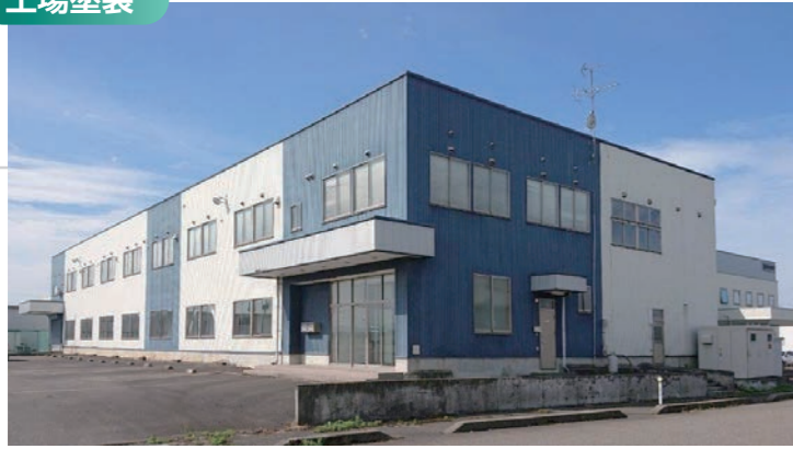
錆止塗装の上にウレタン樹脂塗装仕上げ