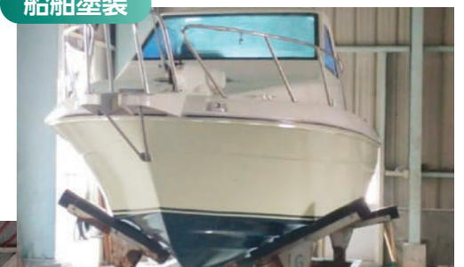
キャビン = ウレタン樹脂 船底 = 防汚塗料