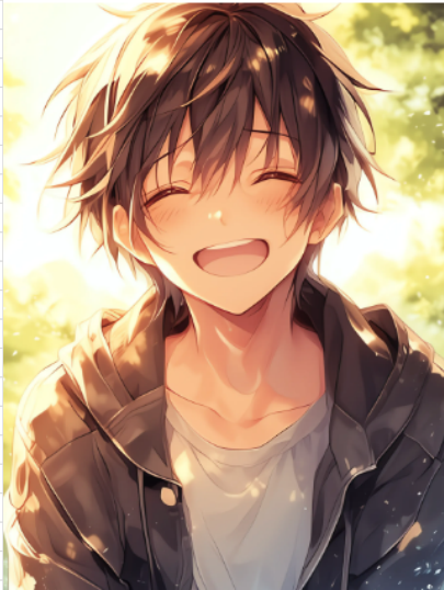
口はAと同じもしくはイの字で笑っている口

→出ていく彼女を精一杯の笑顔で見送る、つらい笑顔を演出したいです 頬の赤らめはなし、眉は八の字、口はAと同じ口もしくは歯をイの字が良いです。