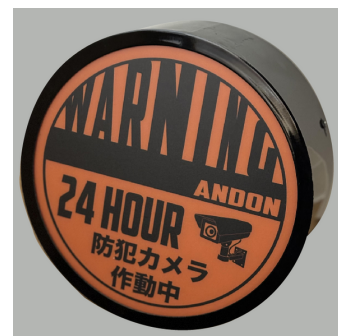
ANDON LIGHT SH01