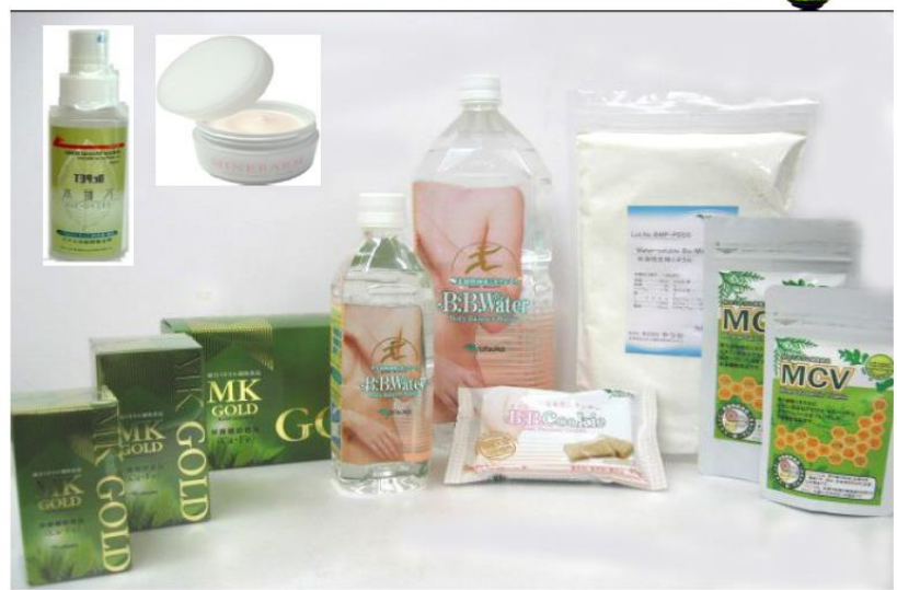
図1 生物ミネラルの特徴と商品群