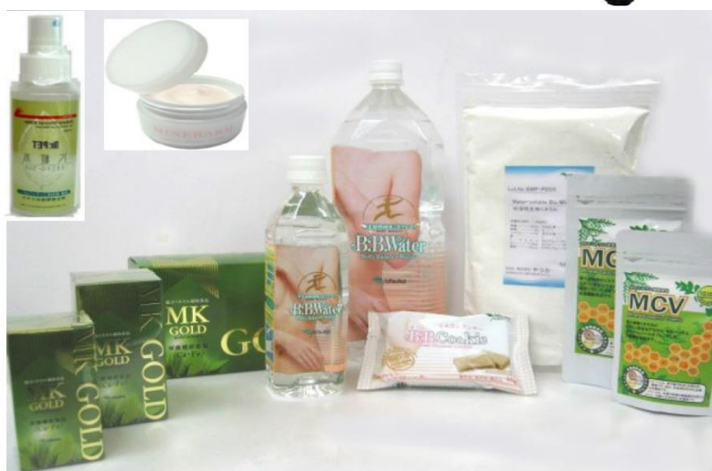
図2 生物ミネラルの特徴と商品群