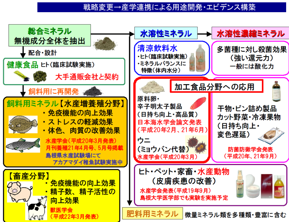
図1 生物ミネラルの用途開発の概要