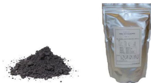
図4 開発された機能性飼料原材料(水産用、畜産用)

これらの共同研究を経て、現在、機能性飼料原材料(水産用、畜産用)「ミネラパウド」として商品化を進め、大手製薬メーカーを始め10社程度に採用されている。(図4参照)