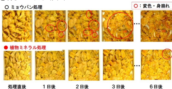
図6 アカウニにおけるミョウバン処理と生物ミネラル処理の差異

島根大学と連携し、水溶性植物ミネラルで処理したアカウニについて調査を行い、身崩れや変色を遅延させることができ、かつ、本来の甘みがある食味であることが確認できた。従来、ウニの変色・身崩れ防止のため行われてきたミョウバン処理に代替でき、ミョウバンの欠点である苦みを抑えることが可能となり、ウニの商品価値の向上につながれることを明らかにした（図6）。