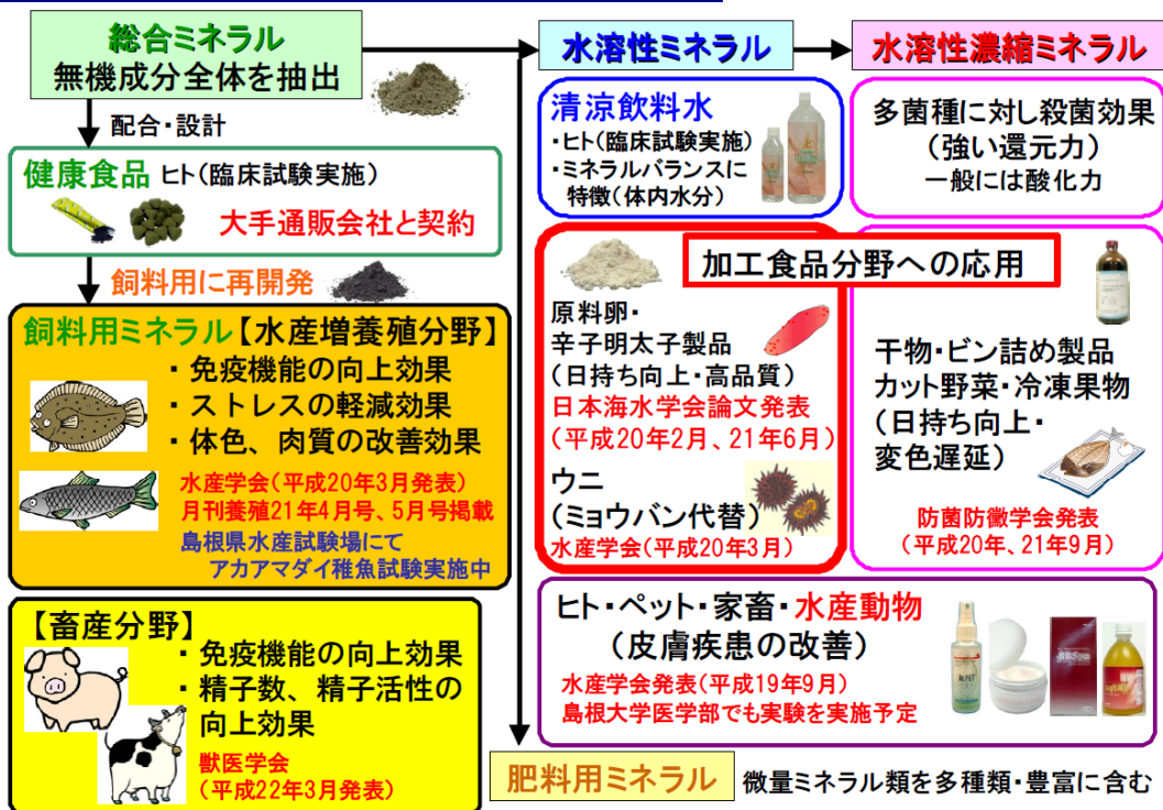
図7 生物ミネラルの用途開発の概要